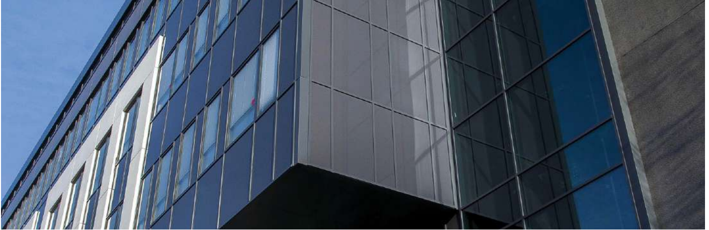
Immeuble Proxima V